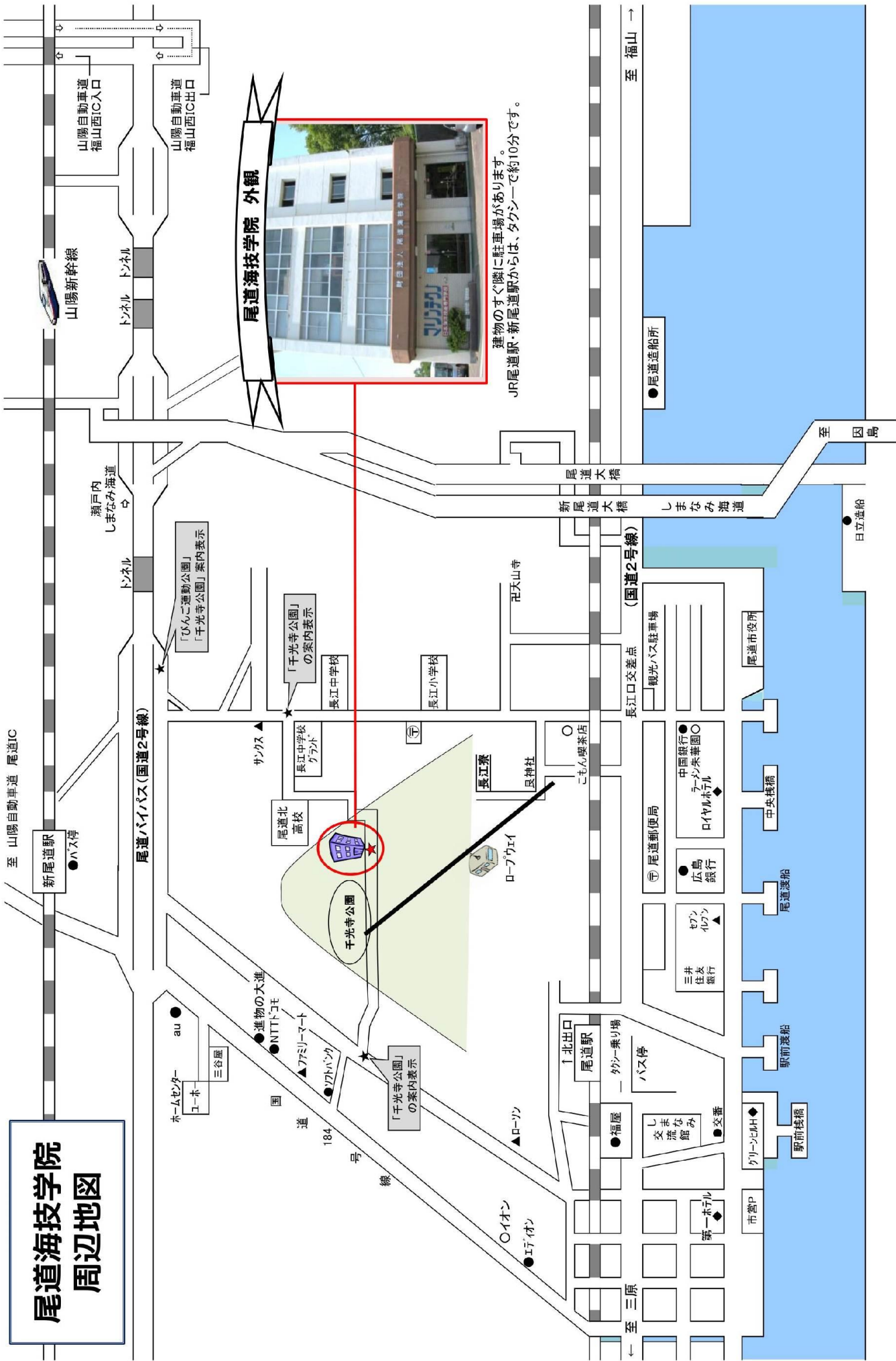
尾道海技学院 外観